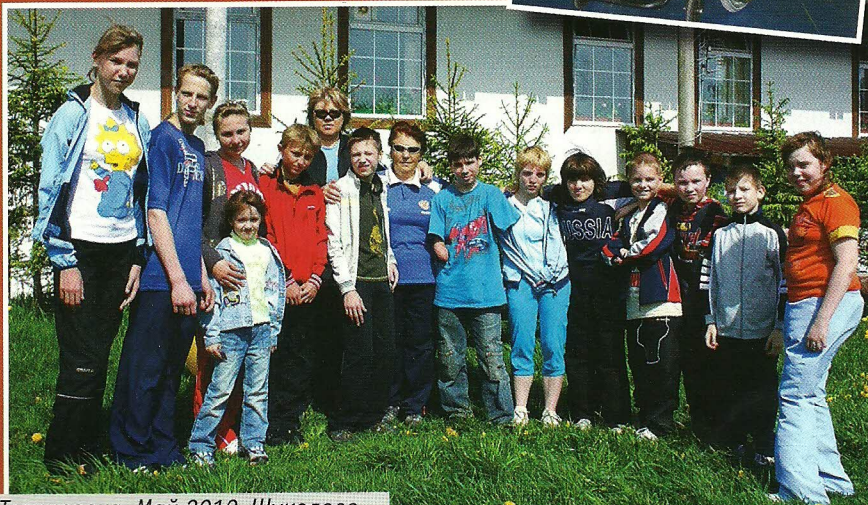
Тренировка. Май 2010, Шуколово.

– В Ванкувере выступила неплохо, но, к сожалению, не смогла полностью восстановить форму после рождения дочери, – сказала спортсменка. – Сейчас уровень паралимпийцев в мире растёт, с командами работают ребята из здоровых сборных, бывшие спортсмены, и они стараются набирать спортсменов с небольшими поражениями. И мне с одной ногой сложно конкурировать с ними. Но, несмотря ни на что, в слаломе я сильна и могу улучшить свои результаты.